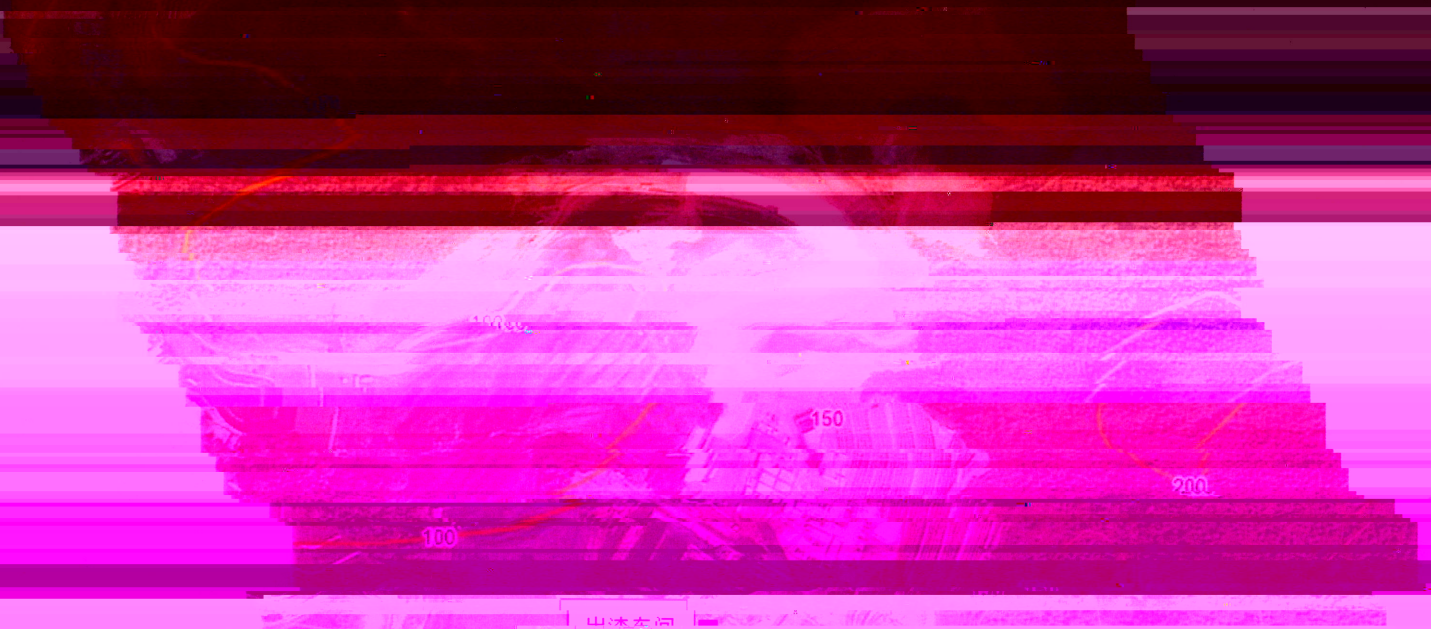
附图1：采样点位示意图