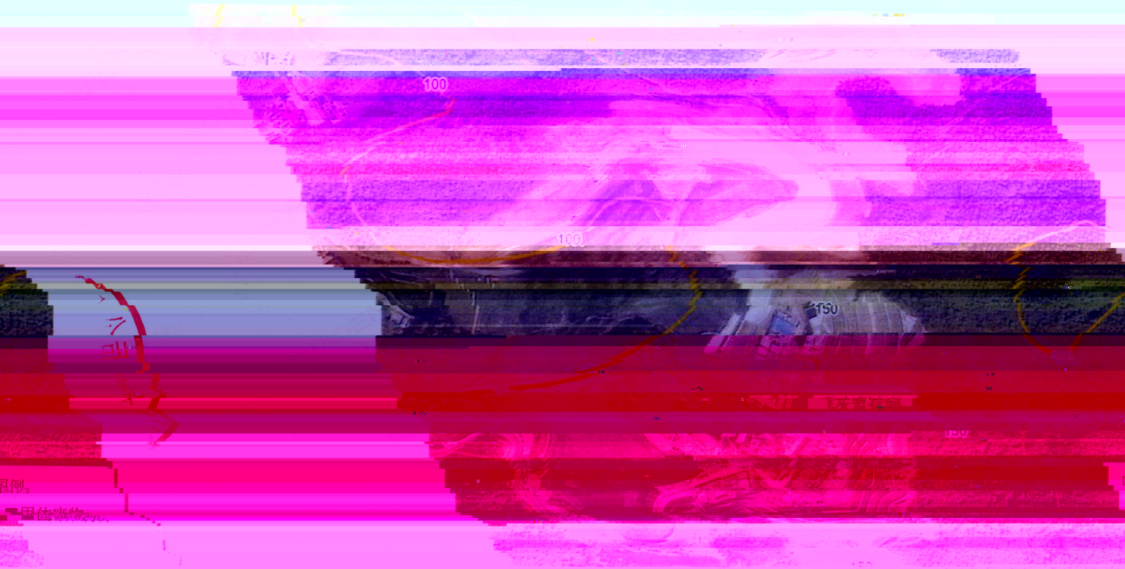
附图 2: 采样照片