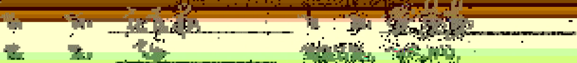
— 检测现场 —