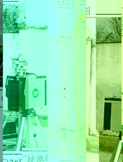
图 2 现场监 字[2023]X1