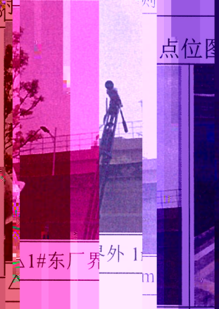
图2 现场监测点位图